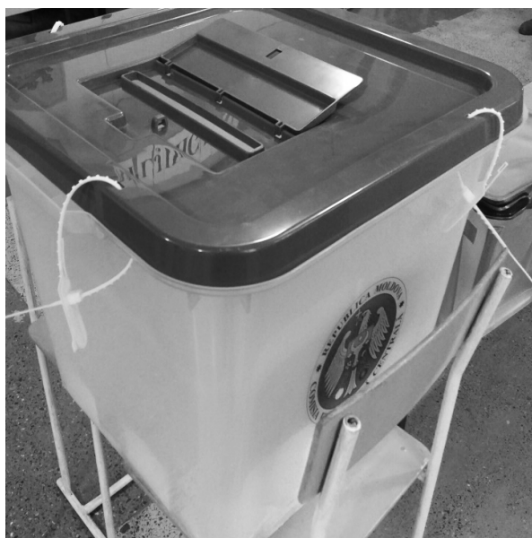
Zdjęcie 1. Nieumiejętnie zaplombowana urna wyborcza w wyborach na Prezydenta Republiki Mołdawii – listopad 2016 roku