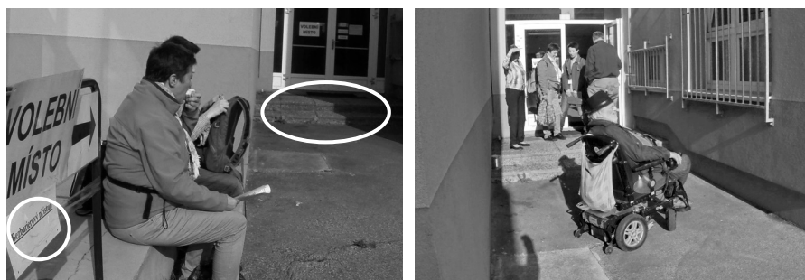
Zdjęcie 3. Lokal wyborczy nieprawidłowo zakwalifikowany jako dostosowany do potrzeb osób niepełnosprawnych