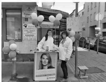
Zdjęcie 5. Kampania w dniu wyborów – Węgry, kwiecień 2018 roku.

Nie we wszystkich krajach w dniu głosowania obowiązuje cisza wyborcza. Na Węgrzech według prawa wyborczego prowadzenie kampanii w dniu wyborów jest dopuszczalne, pod warunkiem że ma miejsce nie bliżej niż 150 m od lokalu wyborczego. Zdjęcie obok pokazuje kampanię wyborczą prowadzoną na ulicy w Budapeszcie w trakcie dnia głosowania, podczas węgierskich wyborów samorządowych 8 kwietnia 2018 roku.