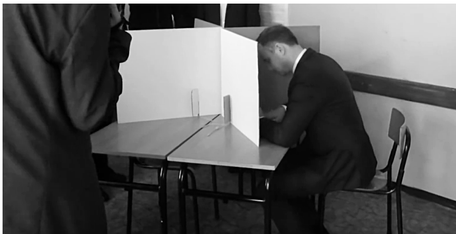
Zdjęcie 2. Kandydat Andrzej Sebastian Duda głosuje w trakcie pierwszej tury wyborów prezydenckich w maju 2015 roku