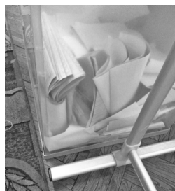
Zdjęcie 4. Dosypane głosy w prawyborach rosyjskich w 2016 roku.

Warto wiedzieć, jak taką wrzutkę rozpoznać. Zadaniem jest ułatwić transparentne urny, przez które widać rozkład kart we wnętrzu. W normalnej sytuacji, gdy wyborcy opuszczają głosy do urny pojedynczo, karty do głosowania rozsypują się. Kiedy mamy do czynienia z wrzutką głosów, karty są zazwyczaj ułożone równomiernie, tworząc pliki papieru, pliki kart do głosowania.